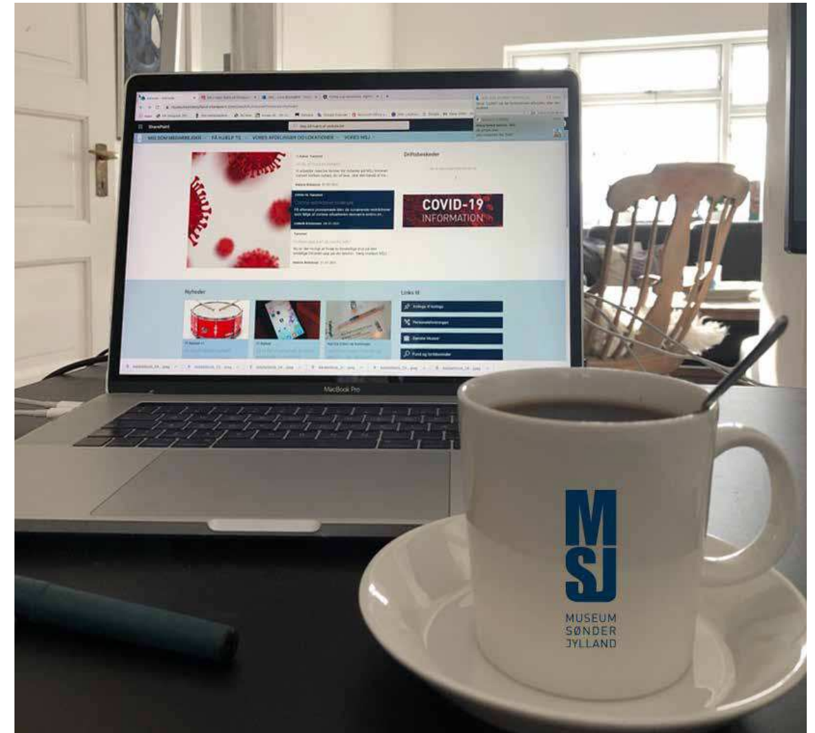
Rettidig kommunikation og kommunikation på tværs er vigtigt i en organisation som Museum Sønderjylland, der driver 10 museer, og hvor medarbejdere er spredt på mange adresser. Det nye intranet blev lanceret 1. februar 2021.