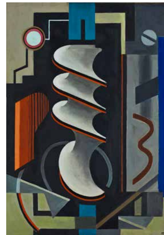
“Skruen” af Franciska Clausen, 1926-28.