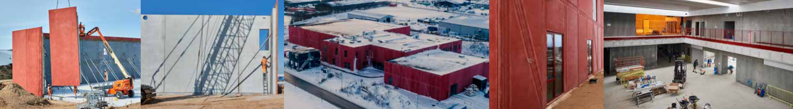
Museum Sønderjyllands nye bevarings- og læringscenter i Rødekro. Bevaringscenter Sønderjylland opføres på grundlag af bidrag fra de fire sønderjyske kommuner, A.P. Møller Fonden, Augustinus Fonden samt Slots- og Kulturstyrelsen.