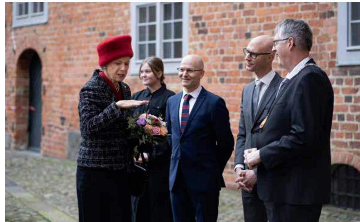
HHK Prinsesse Benedikte modtages i slotsgården på Sønderborg Slot ved åbningen af udstillingen "100 år med Danmark – Sønderjylland siden Genforeningen".

Efter 2020's markering af 100-året for Genforeningen kan ingen være i tvivl om, at Sønderjylland har en særlig historie med en evig aktualitet indbygget i sig. Heller ingen kan være i tvivl om, at den særlige historie kræver en stærk platform at formidle fra. Et stort landsdelsmuseum som Museum Sønderjylland har betydning langt ud over de fire sønderjyske kommuner, det hører hjemme i, og varetager en opgave på hele nationens vegne.