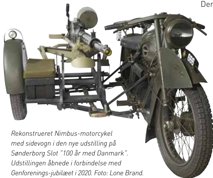
Rekonstrueret Nimbus-motorcykel med sidevogn i den nye udstilling på Sønderborg Slot "100 år med Danmark". Udstillingen åbnede i forbindelse med Genforenings-jubilæet i 2020.

Som overordnede pejlemærker for området arbejdes med en helhedsorienteret gæsteoplevelse i fokus og på at skabe forretningsplaner i balance.