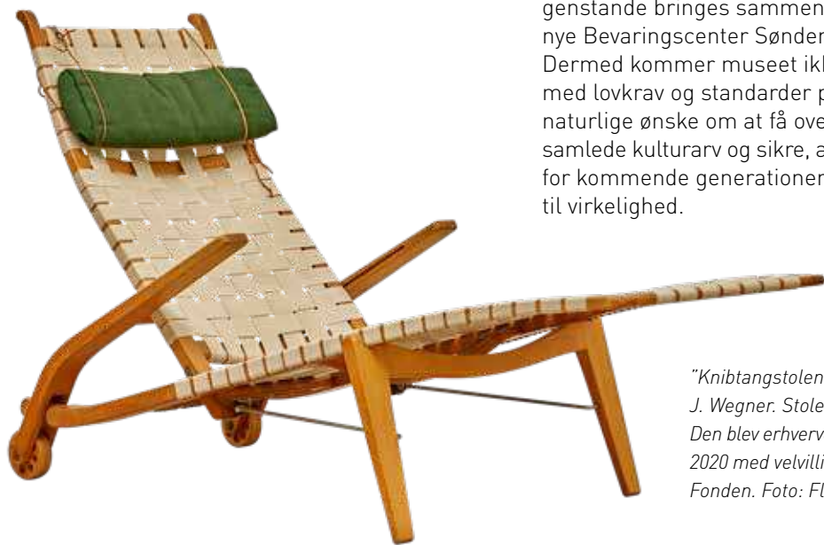
"Knibtangstolen" fra 1956 af Hans J. Wegner. Stolen er yderst sjælden. Den blev erhvervet af museet i december 2020 med velvillig støtte fra Augustinus Fonden.

Museum Sønderjyllands ca. 250.000 museums-genstande bringes sammen under ét tag i det nye Bevaringscenter Sønderjylland i Rødekro. Dermed kommer museet ikke blot på forkant med lovkrav og standarder på området, det naturlige ønske om at få overblik over den indsamlede kulturarv og sikre, at den er tilgængelig for kommende generationer, kan nu også blive til virkelighed.