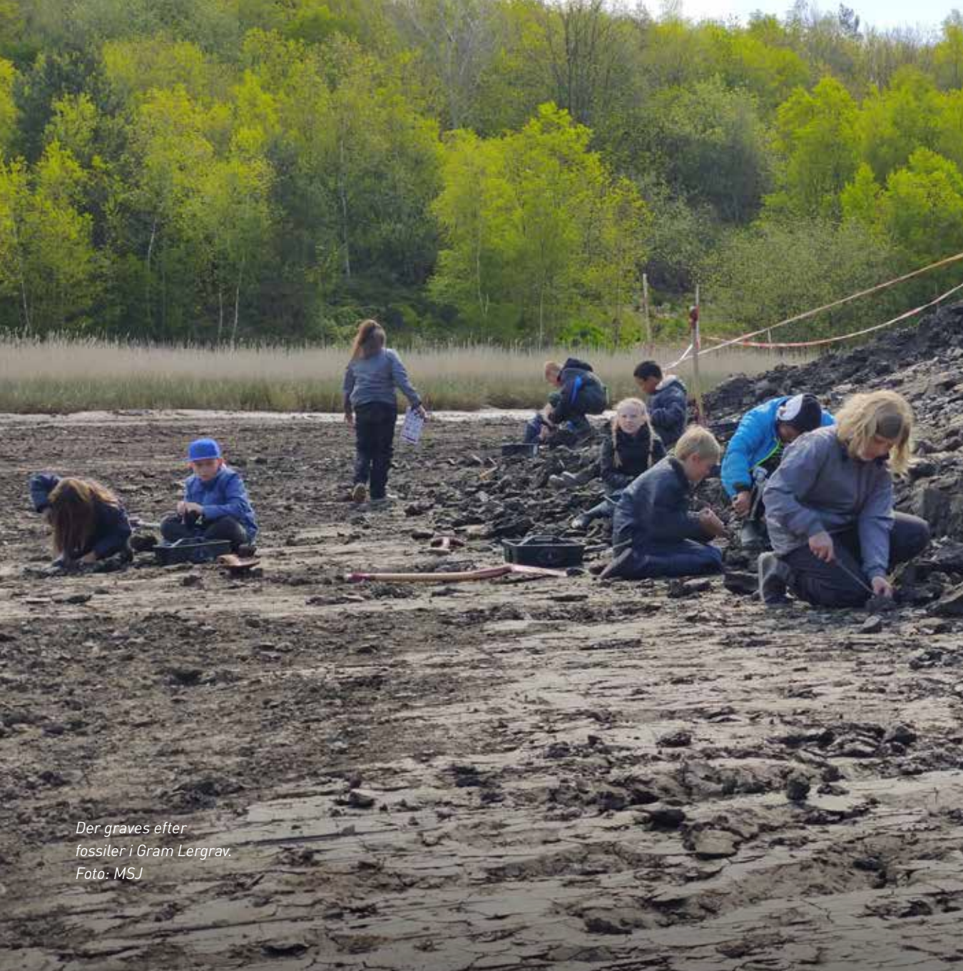
Der graves efter fossiler i Gram Lergrav.