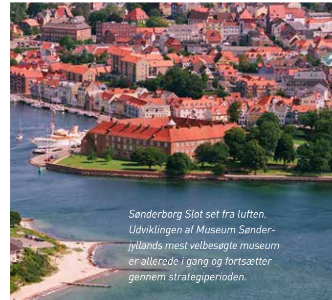
Sønderborg Slot set fra luften. Udviklingen af Museum Sønderjyllands mest velbesøgte museum er allerede i gang og fortsætter gennem strategiperioden.

mål for investeringer, der betyder, at de er på et udmærket niveau og værd at besøge. I strategiperioden vil der på disse steder primært være fokus på velfungerende daglig drift, justeringer og tilpasninger. For enkelte vil der blive afsøgt nye drifts- og samarbejdsformer.