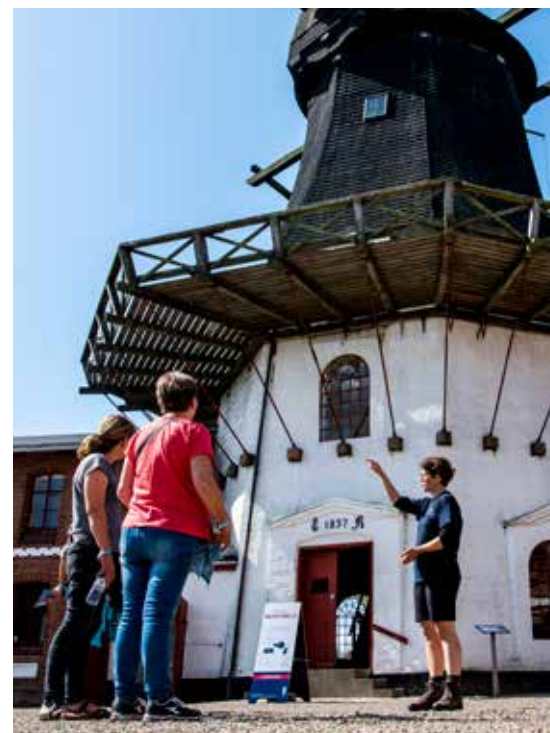
Højer Mølle og hele det tilhørende bygningskompleks har undergået en restaurering og transformation til nyt, tidssvarende museum i 2019-20.