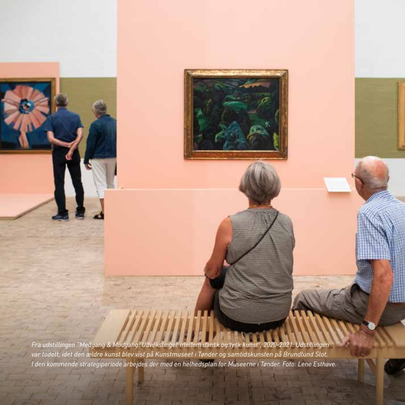
Fra udstillingen "Medgang & Modgang: Udvekslinger mellem dansk og tysk kunst", 2020-2021. Udstillingen var todelt, idet den ældre kunst blev vist på Kunstmuseet i Tønder og samtidskunsten på Brundlund Slot. I den kommende strategiperiode arbejdes der med en helhedsplan for Museerne i Tønder.